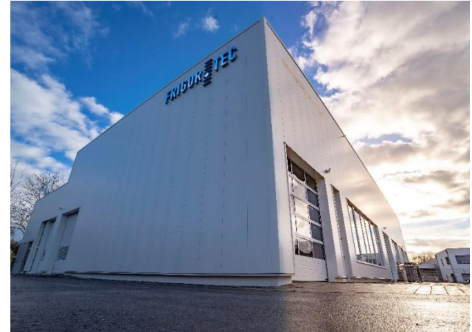
Fertigungshalle Getreidekühlgeräte in Amtzell